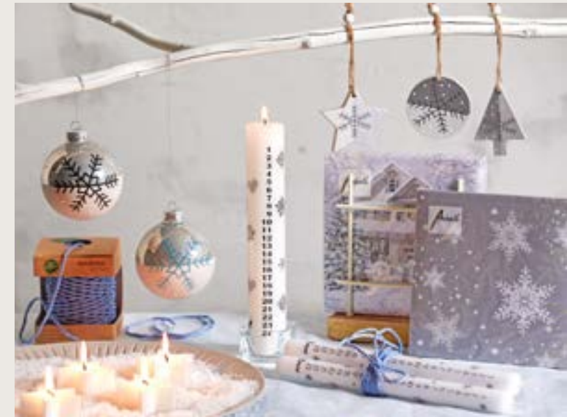
Ein Spaziergang im Schnee inspiriert die helle, schlichte Schönheit der Materialien, Farben und Motive zu einer ruhigen, puren Feststimmung.