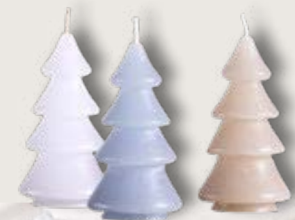
A walk in the snow inspires the bright, simple beauty of the materials, colours and motifs to create a calm, pure festive mood.